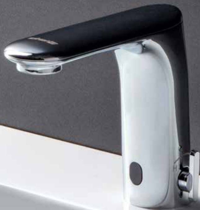
“Otto” by Luca Papini