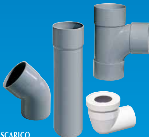
LINEA SCARICO BAGNO IN PVC M1