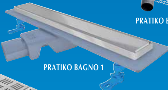
PRATIKO BAGNO 1