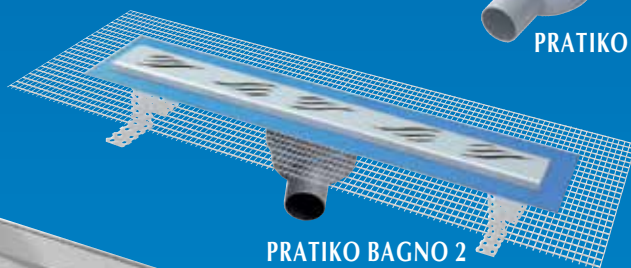
PRATIKO BAGNO 2