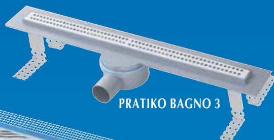
PRATIKO BAGNO 3