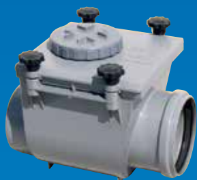
VALVOLA DI NON RITORNO