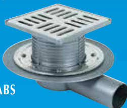
CHIUSINI SIFONATI IN PP E ABS